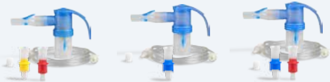
PARI Year Pack BOY Junior Austauschset für PARI BOY Junior