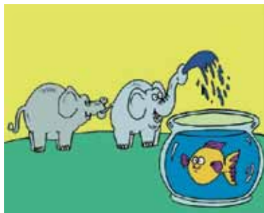
Pädiatrische Anreiz Animationen